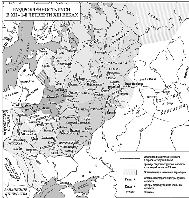
Рис. 1. Карта XII–XIII вв.

Период феодальной раздробленности на территории Руси – достаточно сложное время в историческом аспекте. Не только бесчисленные междоусобные войны, периодические татаро-монгольские походы на земли, но и постоянные дробления княжеских владений особенно характеризуют промежуток с XII по конец XV в. Так, в середине XII в. существовало около 15 княжеств, а уже к началу XIV в. их количество достигало 250 (Рыбаков 1982). Княжества формировались, распадались, а затем снова воссоединялись с уже другими территориями (рисунок 1). Именно поэтому данный период так актуален для историков и антропологов.