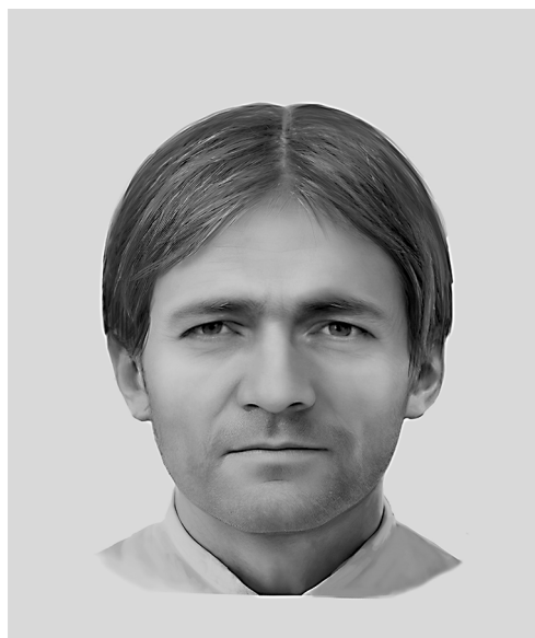
Рис. 4. Переславль-Залесский. XII–XIII вв.