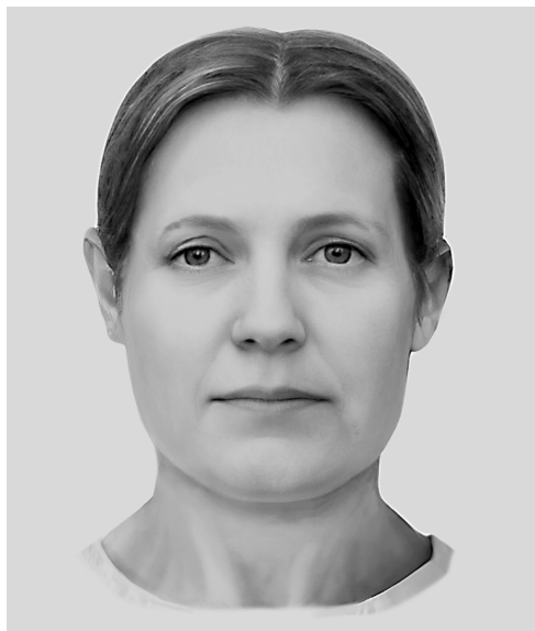
Рис. 8. Полоцк. XII–XIII вв.

погребенное на территории Верхнего замка, как относительно мирное. На это также указывает отсутствие следов применения холодного или метательного оружия. Образцы Pol-5 и Pol-12 принадлежат к Y-хромосомным гаплогруппам, являющимся дочерними по отношению к R1a (Z280) – восточно-европейской славянской гаплогруппы. Гаплогруппа, выявленная у исследованного образца Pol-11, является производной от I2a1(S238) и имеет балканское происхождение. Ее носители во время славянского распространения попадают на территорию Древней Руси через Карпаты. У образца Pol-3 (вероятно, из-за высокой деградации ДНК) была выявлена только корневая гаплогруппа, имеющая североафриканские корни. Ее дочерняя гаплогруппа E1b(V13) имеет наибольшую плотность распространения на Балканах. Ее носители во время славянского распространения попадают на территорию Древней Руси (рисунок 8).