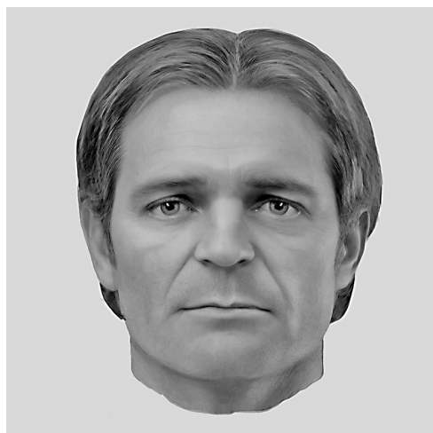
Рис. 6. Унорож. XI–XIV вв.