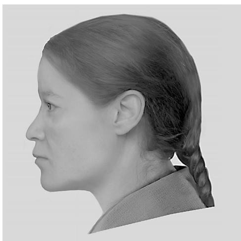
Рис. 7. Унорож. XI–XIV вв.

зовались ростом малым и ниже среднего. Все женщины характеризовались узкими плечами и чаще всего довольно узким тазом. При этом таз, согласно расчетам тазовых индексов, у женщин был, как и положено, довольно низким. Длина тела, которую имели женщины при жизни, варьировала в группе от почти 147 см до 160,5 см. То есть женщины группы обладали малым ростом, средним и даже больше среднего.