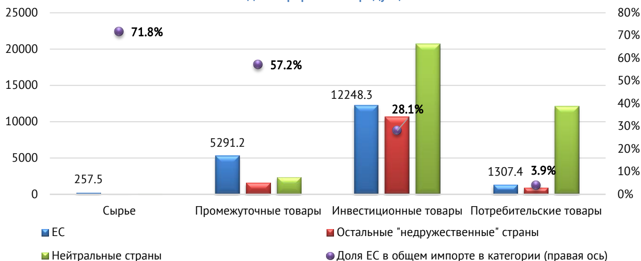
Структура санкционных перечней и объемов импорта, попадающего под них, по классификации ЮНКТАД стадий переработки продукции