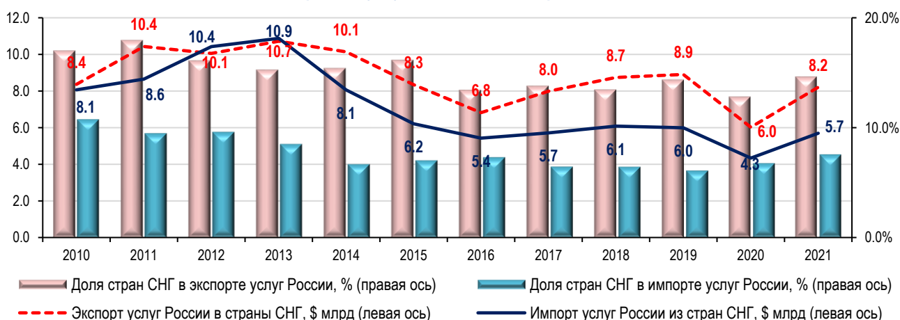
Динамика внешней торговли услугами России со странами СНГ в 2010-2021 гг.

Примечание: с учетом услуг, не распределенных по отдельным странам.