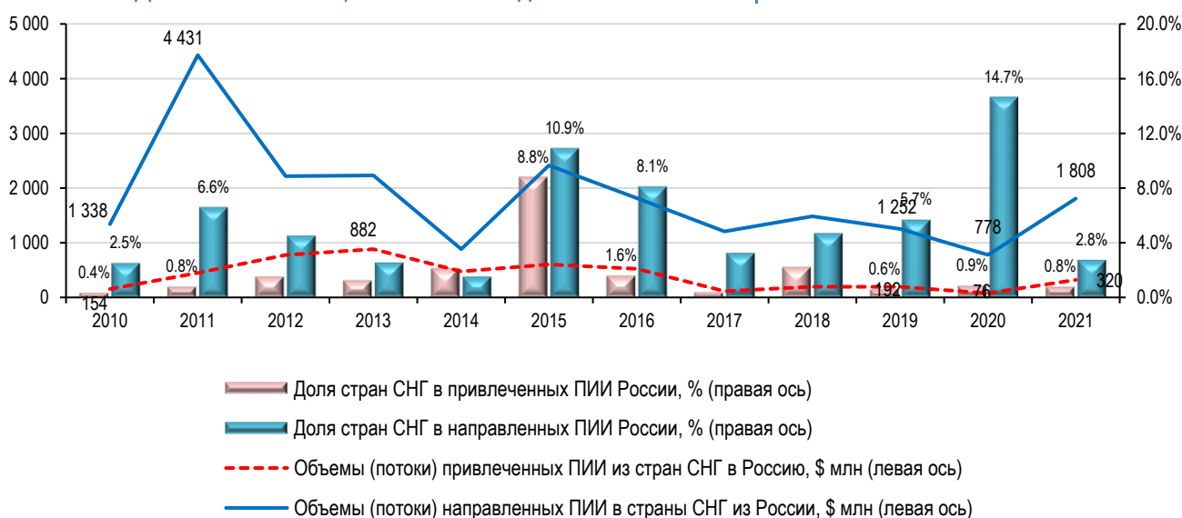
Динамика инвестиционного взаимодействия России со странами СНГ в 2010-2021 гг.

Примечание: с учетом ПИИ, не распределенных по отдельным странам.