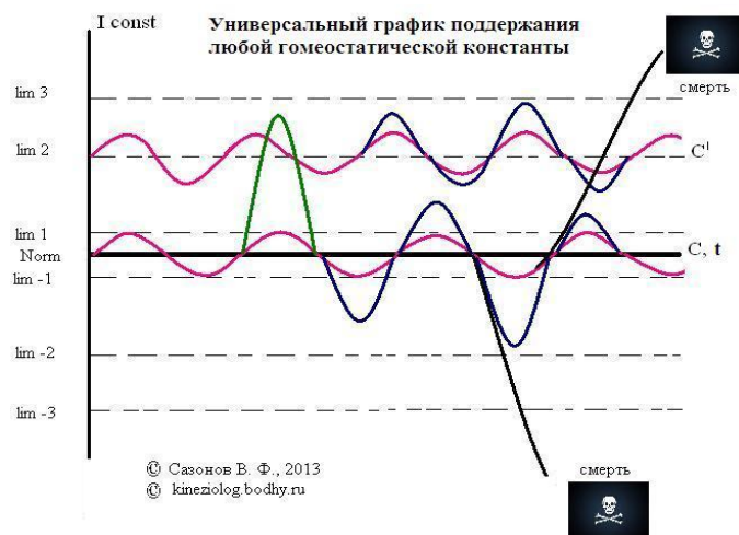
Универсальный график поддержания гомеостатического равновесия

«Поскольку колебание гомеостатической константы допустимо в определённых пределах, то за счет автоматического гашения отклонений гомеостатический параметр настойчиво возвращается к средней линии. В идеале данный механизм стремится минимизировать колебания гомеостатического параметра вокруг средней линии. Чем лучше работает этот механизм, тем меньше будут колебания» 3 .