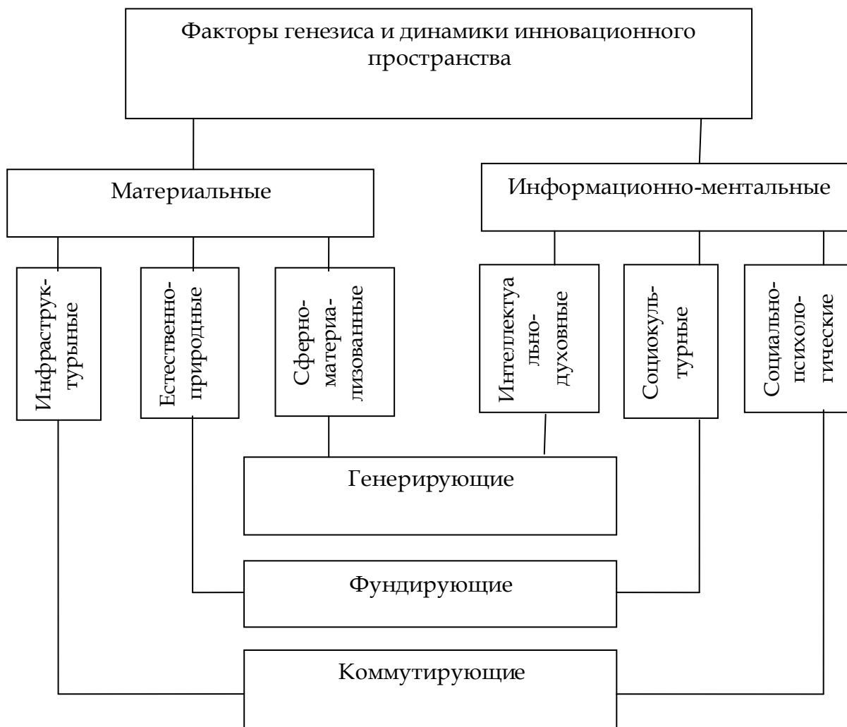
Рисунок. Факторы генезиса и динамики инновационного пространства (разработка автора)

связи, транспорта и др.). Названные группы факторов генезиса и динамики инновационного пространства представлены в следующей структурной схеме: