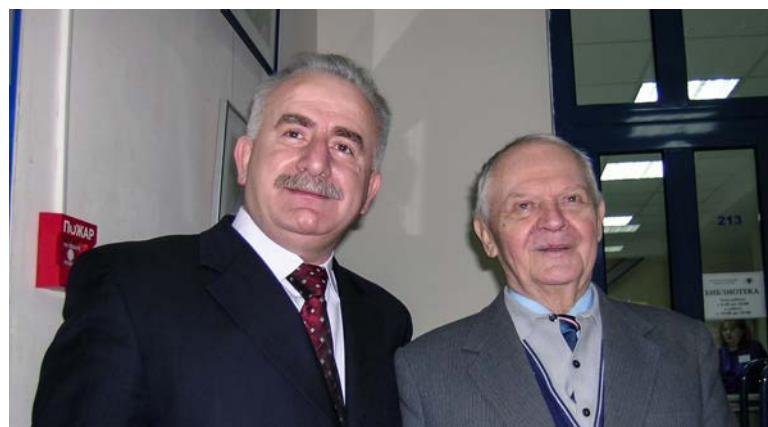
Публикуется впервые.

На фото: Б.Ч. Месхи и председатель Северо-Кавказского научного центра высшей школы, член-корреспондент РАН Ю.А. Жданов (2004).