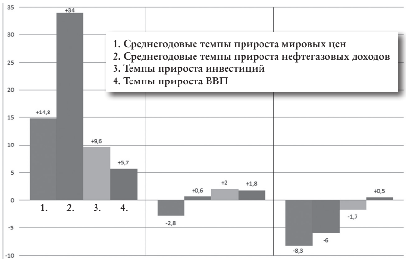
Рис. Среднегодовые темпы прироста мировых цен на нефть (Brent), нефтегазовых доходов, инвестиций в основные фонды и ВВП России.

Необходимо так настроить налоговую систему, чтобы прибыльность вложений капитала в обрабатывающие отрасли была выше по сравнению с сырьевыми отраслями. Для этого следует: