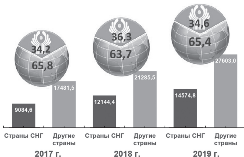
Рис. Динамика внешнеторгового оборота Республики Узбекистан со странами СНГ и другими государствами (на столбиках указан товарооборот в млн долл., на кругах – его доля в %)