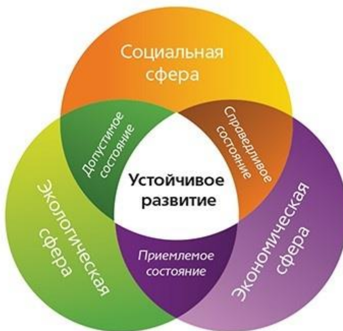
Рисунок 1. Взаимосвязь факторов устойчивого развития города [6]

В общем приближении под устойчивым развитием следует понимать единство экономического и социального прогресса, достижимого в условиях сохранения окружающей среды (рис. 1). При этом состояние социальной сферы выступает первичным индикатором устойчивости в целом. Судить об этом можно исходя из перечня конкретных целей перехода к устойчивому развитию, принятого странами-участницами ООН 25 сентября 2015 г. в Повестке дня в области устойчивого развития на период до 2030 г. Так, 9 из 17 целей (ликвидация нищеты и голода, хорошее здоровье и благополучие, качественное образование, гендерное равенство, чистая вода и санитария, достойная работа и экономический рост, уменьшение неравенства, ответственное потребление и производство) напрямую касаются качества жизни рядовых граждан; достижение остальных 8 обуславливают его в более отдаленной перспективе. Первые из них суммарно имеют для России главный приоритет: разрабатывающихся и готовых к разработке показателей – 41,1% (разрабатывающихся и готовых к разработке показателей по второй группе целей – 30,4% [2]), что во многом связано с переходом нашей страны к новому типу социальной организации, так как внедрение ИКТ в практику повседневной жизни требует повышения и стабилизации базовых показателей качества жизни. В первую очередь, здесь следует иметь в виду показатели демографической ситуации.