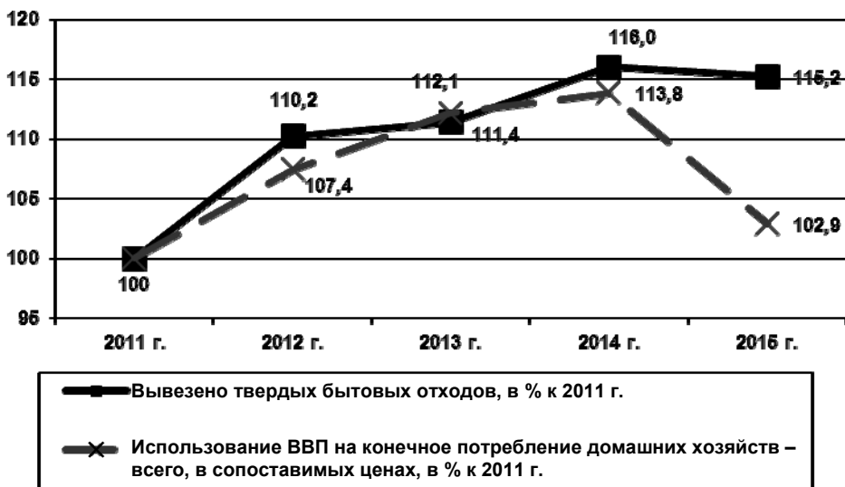
Рис. 2. Изменение объема вывезенных из селитебных зон ТБО и величины ВВП, использованной на конечное потребление домашних хозяйств в России

Очевидно, что размеры декаплинга могут быть представлены в первую очередь в графическом виде или в форме простого соотношения темпов роста/снижения какого-либо натурального показателя природопользования (включая индикатор негативного воздействия на окружающую природную среду) и темпов роста/снижения отобранного макростатистического агрегата в постоянных ценах . При этом в цифровом виде данное расхождение, по нашему мнению, статистически корректно показывать в процентных пунктах, п. п. (то есть разницей между процентами). В случае относительного декаплинга при одновременном снижении темпов двух рассматриваемых векторов процентные пункты целесообразно давать с отрицательными знаками. При наличии абсолютного декаплинга результаты могут приводиться по модулю разницы для показателей с положительным и отрицательным знаками.