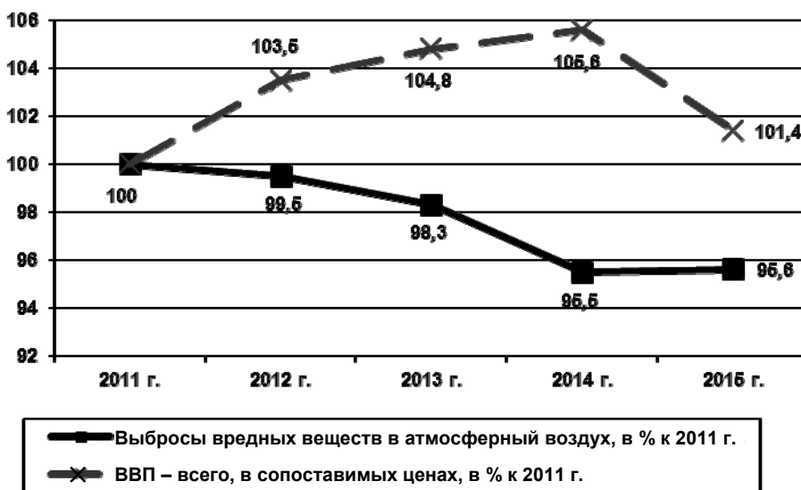
Рис. 1. Изменения объема выбросов вредных веществ в атмосферный воздух и величины ВВП в России

Относительный декаплинг, кроме соотношений, описанных в ПРД СПЭУ, наблюдается в случаях, когда темпы роста природопользования/вредного воздействия на природу превышают (опережают) темпы роста выбранного макроагрегата. В частности, из рис. 2 следует, что в 2012 г. по сравнению с 2011 г. и в 2014 г. по сравнению с 2013 г. увеличились как объем потребленного ВВП, так и вывоз ТБО из селитебных зон. Однако темпы роста вывоза ТБО за эти периоды оказались выше, нежели темпы роста ВВП, использованного на конечное потребление домашних хозяйств.